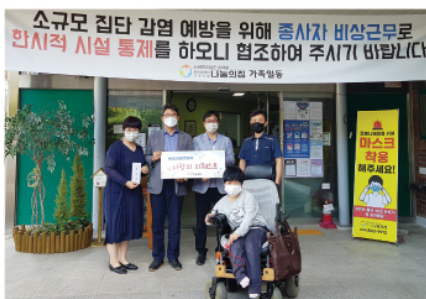
9/28 한국전기안전공사 임직원 후원금 전달