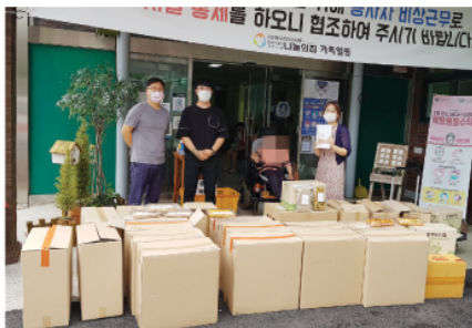
8/13 소나무상사 후원 물품 전달