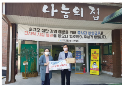
9/25 한국도로공사 충주지사 상품권 전달