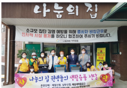
9/23 햇살직접봉사사회, 햇살봉사회, 남부신협, 예성새마을금고 후원금 및 후원 물품 전달