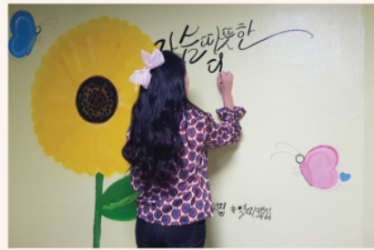
캘리그래피 작가 별찌(이혜정)