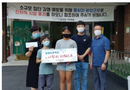
9/10 동량초등학교 바자회 수익금 전달