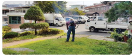
9/26 사단법인 충주숲 나눔의집 정원 가꾸기 봉사활동