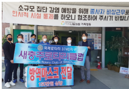
5/21 새충주로타리클럽 후원 물품 전달