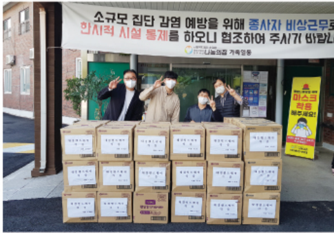
2020. 10. 7 대경헬스케어 후원물품 전달