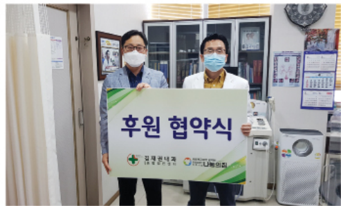
2021. 4. 13 김재권내과의원 후원 협약 체결