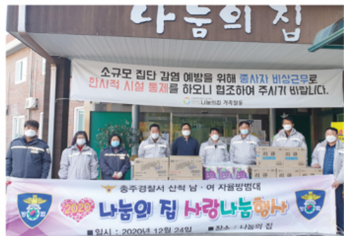
2020. 12. 24 산척자율방범지구대 후원물품 전달