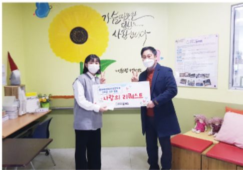
2020. 12. 10 충주예성여자고등학교 3학년 1반 후원금 전달