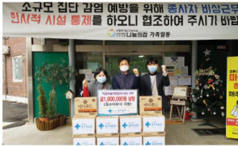
2020. 10. 29 충주의료원 후원물품 전달