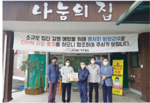
2020. 10. 13 에스오일 상품권 전달