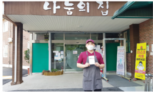
2021. 3. 17 충주 본죽(호암점) 정기후원 신청