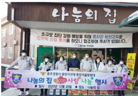
2020. 12. 20 중앙방범지구대 후원물품 전달