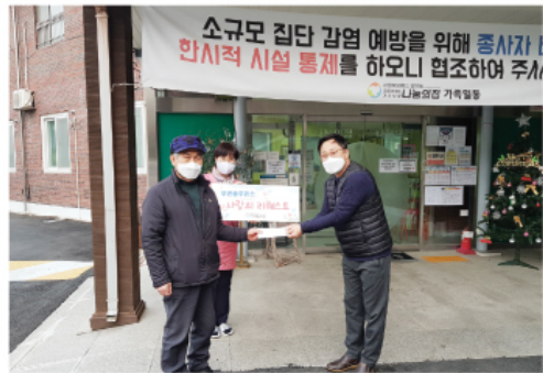
2020. 12. 11 푸른솔 주유소 상품권 전달