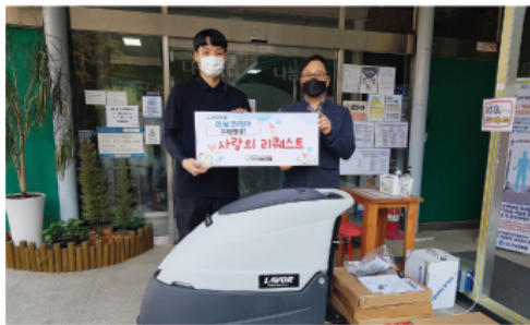
2021. 4. 6 대본통상(라보코리아) 대형청소기 후원