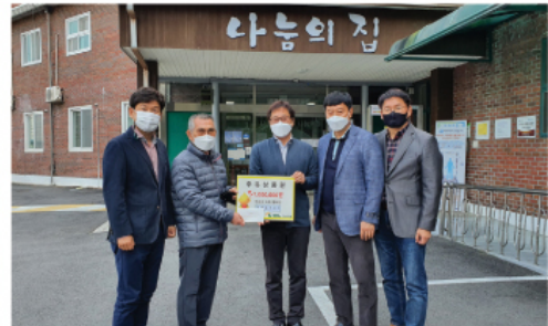
10. 27 에쓰오일 사회봉사단 주유상품권 전달