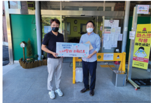
9. 16 한국도로공사 온누리상품권 전달