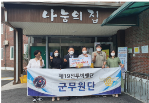
9. 16 19전투비행단 군무원단 후원금 전달