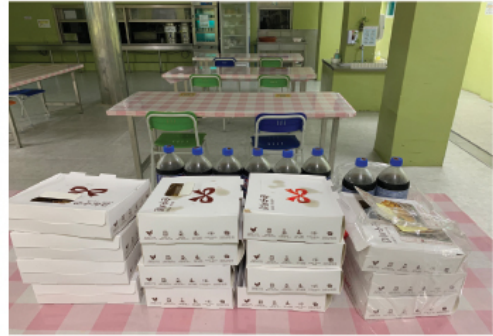
8. 25 순수치킨 후원물품 전달