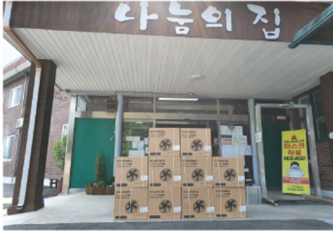
7. 28 (주)태우산업 후원물품 전달