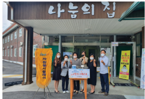
9. 16 충주시 여성기업인협회 후원물품 전달