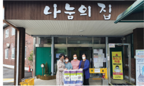
10. 7 나눔사랑회 후원물품 전달