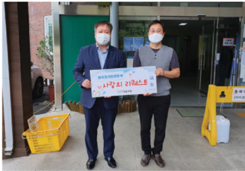
9. 14 한국전기안전공사 후원금 전달