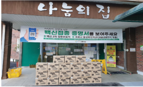
2022. 1. 26 충북북부보훈지청 후원물품 전달