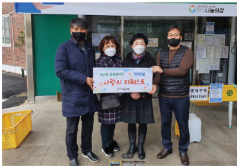
2021. 12. 29 용산동 통장협의회 후원금 전달