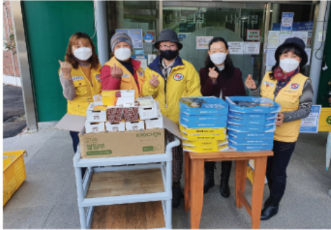
2021. 12. 23 햇살봉사회 후원물품 전달