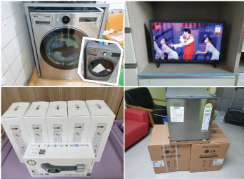
김재권내과의원에서 보내주신 지정후원금(비품구매)을 사용하여 대형 세탁기 및 건조기, 냉장고, 체온계, TV를 교체하여 사용하고 있습니다.