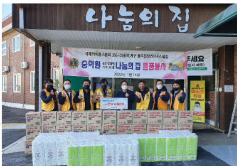
2022. 1. 16 밀알라이온스클럽 후원물품 전달