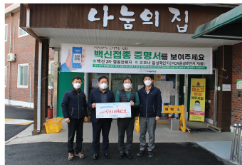
2022. 1. 16 한국전기안전공사 임직원 후원금 전달