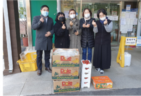
2021. 12. 23 새충주로타리 배우자회(미지회) 후원물품 전달