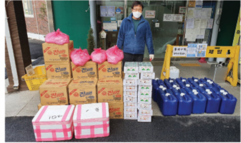
2022. 1. 26 대장식당 후원물품 전달