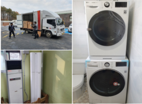
연민복지재단에서 나눔의집 가족들을 위한 세탁기와 건조기, 스탠드 에어컨을 후원해주셨습니다