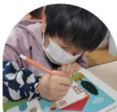
꼼꼼하게 정성을 다해 색칠 하는 그림 그리기 장인 영씨♡