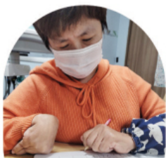
스스로 문제를 읽고 풀어가는 엘리트 귀족씨♡

과일과 음식, 동물, 사물, 계절 등 여러 가지 이름 익히기! 동그라미, 세모, 네모 도형, 직선, 곡선 그리기! 하나, 둘, 많다, 적다 등 수학 용어 배우기로 입주민들이 쉽게 다가갈 수 있고, 한 장씩 차근차근 놀이하듯 배워갈 수 있는 학습지를 선택하여 “나눔이네 한글반”을 운영하고 있습니다.