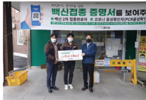
2021. 12. 31 (주)대흥레미콘 후원금 전달