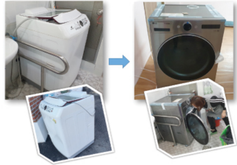
해피빈에서 보내주신 지정후원금(세탁기교체)을 사용하여 노후 된 세탁기를 교체하였습니다.