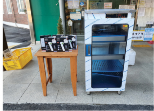
제일신협, 남부신협, 예성새마을금고, 햇살봉사회에서 보내주신 지정후원금 (체온계, 컵소독기 구매)을 사용하여 체온계와 컵소독기를 교체하였습니다.